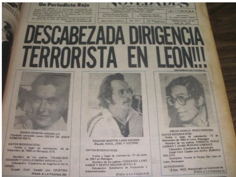
Diario Novedades . 18 de abril de 1979. La misma noticia del asesinato de los dirigentes sandinistas. Nótese el lenguaje del diario de la dictadura somocista al referirse a los guerrilleros