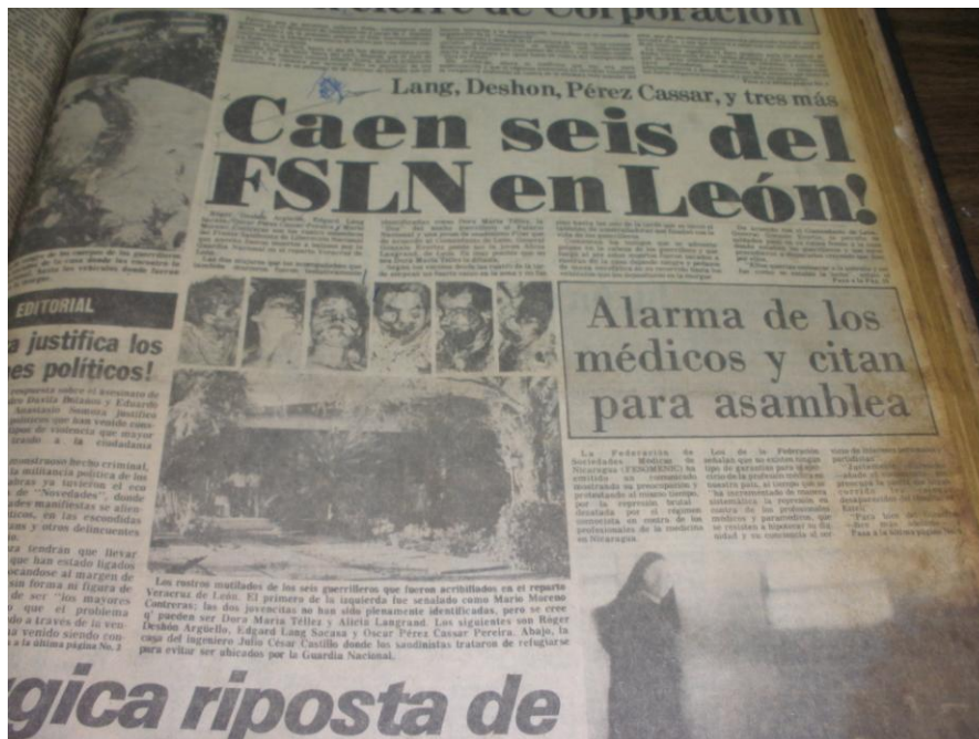
Diario La Prensa . 18 de abril de 1979, dos días después del asesinato del Estado Mayor del Frente Occidental Rigoberto López Pérez, conocidos más tarde como los “Héroes y Mártires de Veracruz”