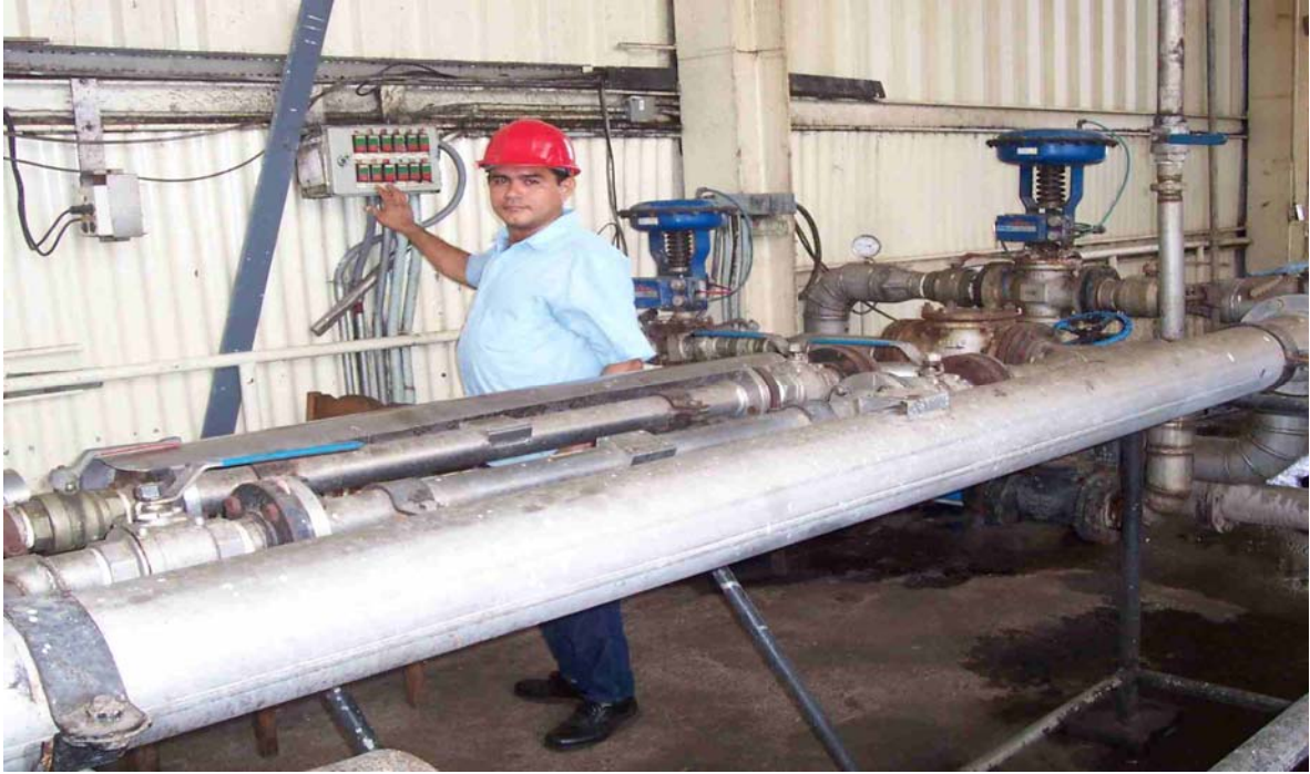
Ilustración 2. Mezclador en Línea.