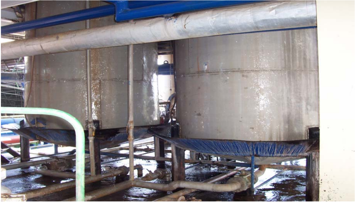
Ilustración 1. Prefermentador.

La determinación de la densidad del mosto se realiza utilizando la tabla que se detalla en la siguiente página.