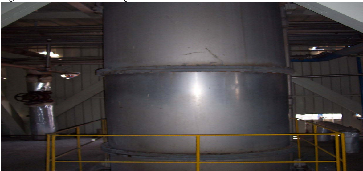
Ilustración 3. Cuerpo de una Columna de Destilación

El aumento de los costos de energía térmica, si provino de gas natural, aceite combustible carbón o biomasa, esta creando un énfasis aumentado en la recuperación de calor y una reducción en la energía térmica primaria usada. El fondo convencional para la alimentación de los intercambiadores de calor está siendo ahora complementado con la recuperación del calor del vapor latente en la parte de arriba por el precalentamiento del líquido de alimentación y otros líquidos del proceso intermedio. Las técnicas de destilación por múltiples etapas (similar al de múltiples efectos de evaporación) son también practicadas. Presión atmosférica, vacío atmosférico o presión al vacío son utilizadas en las fases de la columna, con la energía térmica pasando arriba desde una columna para proveer al hervidor calor para la próxima etapa. Tal que las dos etapas sean bastante comunes y que las tres etapas del sistema también hayan sido utilizadas. Además, la técnica moderna de recompresión de vapor, la cual es comúnmente usada en los sistemas de evaporación, está también siendo propuesta, y en algunos casos, aplicadas para sistemas de destilación. Tal sistema puede proveer por compresión del vapor de arriba una presión y temperatura conveniente para usarlo en el hervidor de la columna de agotamiento, sin embargo el grado de compresión requerida para el recubrimiento del tal calor puede consumir tan alta energía eléctrica como podría ser seguro en el suministro de energía. 6