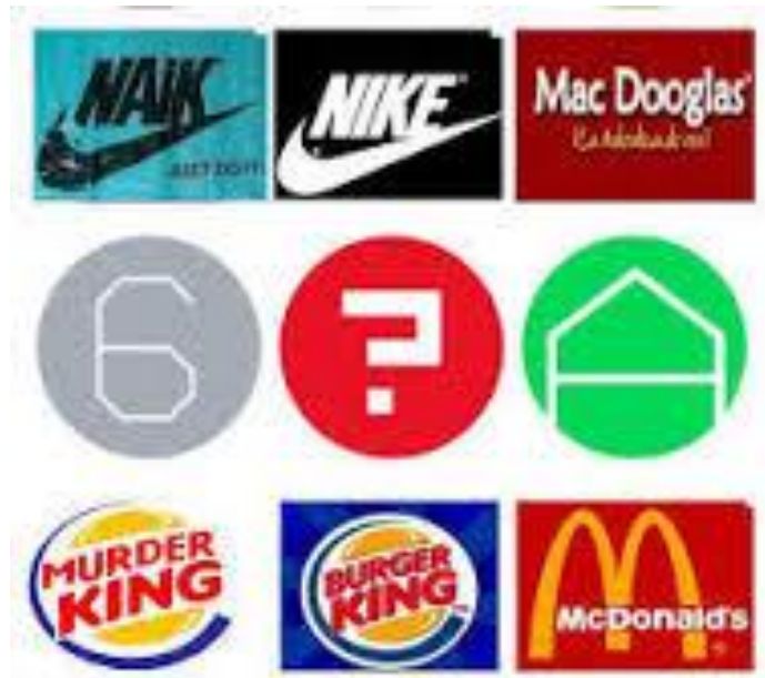
Actos de Fraude