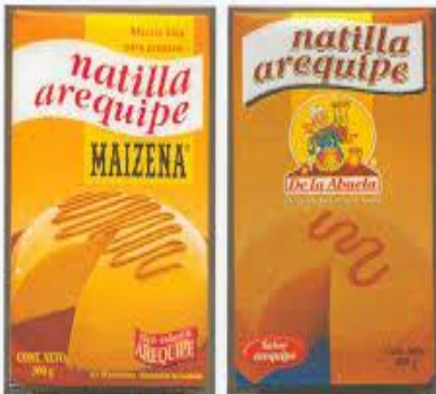
Actos de Imitación