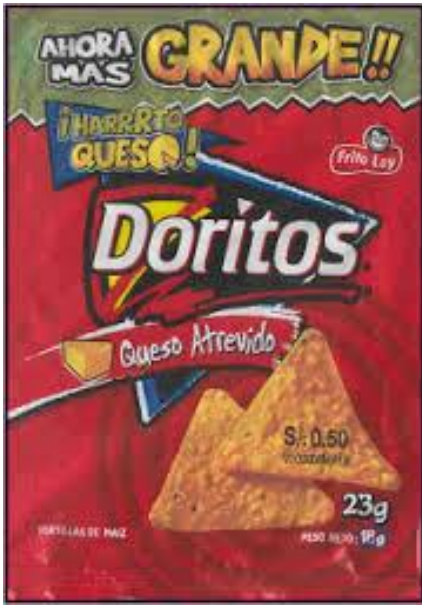
Actos de Engaño