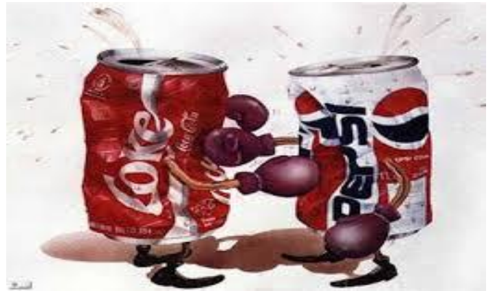
Actos de Comparación