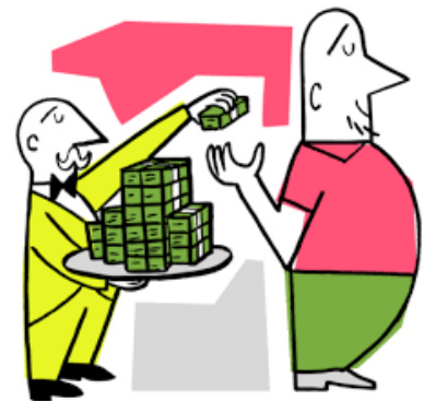
Actos de Inducción