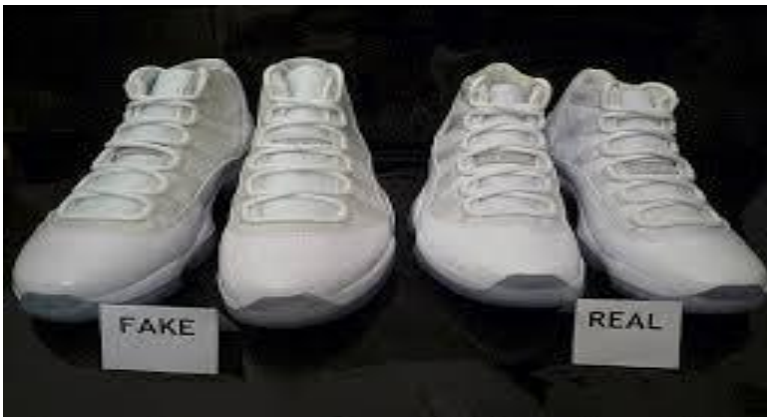
Actos de Confusión