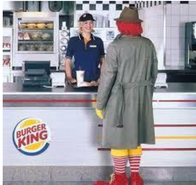
Actos de Maquinación Dañosa