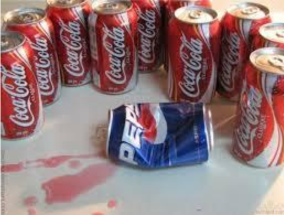
Actos de Denigración