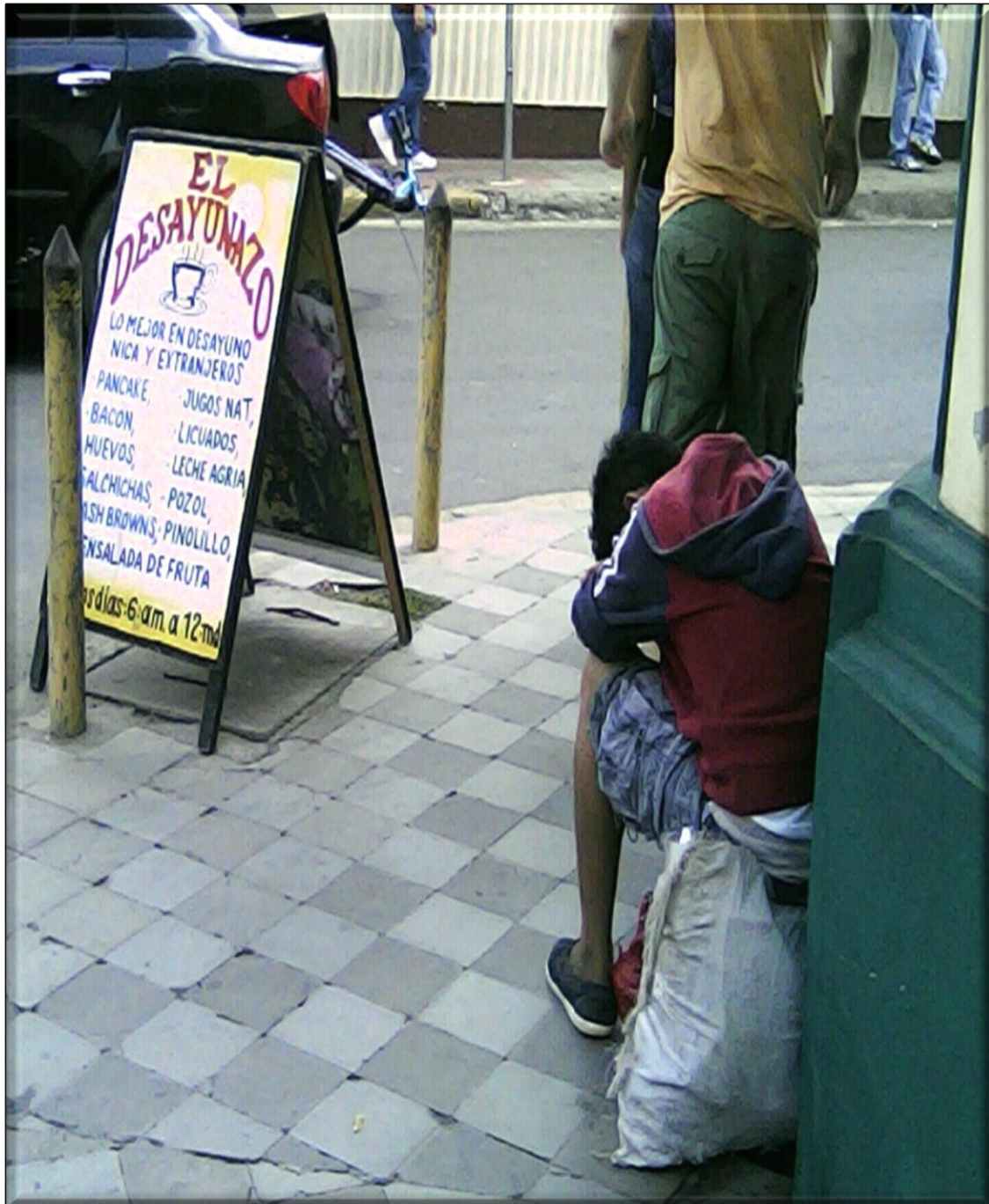
El drama del trabajo infantil está a la vista de la indiferencia social. Fotografía tomada de la antigua Mercantil una cuadra al oeste en la ciudad de León,