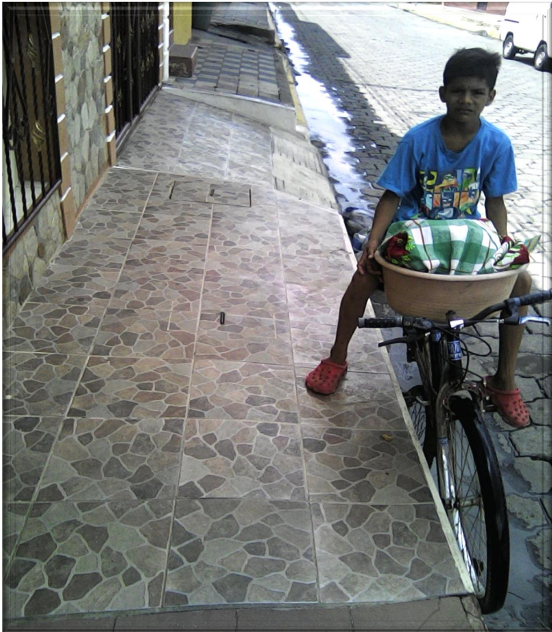
Foto tomada en el Barrio Sutiava de la Ciudad de León, el 07 de junio de 2016. Este niño ha pasado los últimos cuatro años de su vida a vender tortillas.