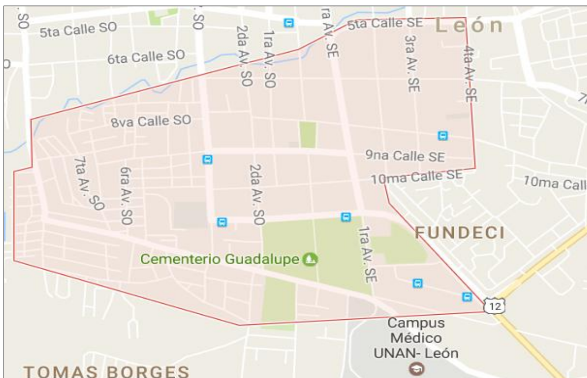
Figura 1. Barrio de Guadalupe