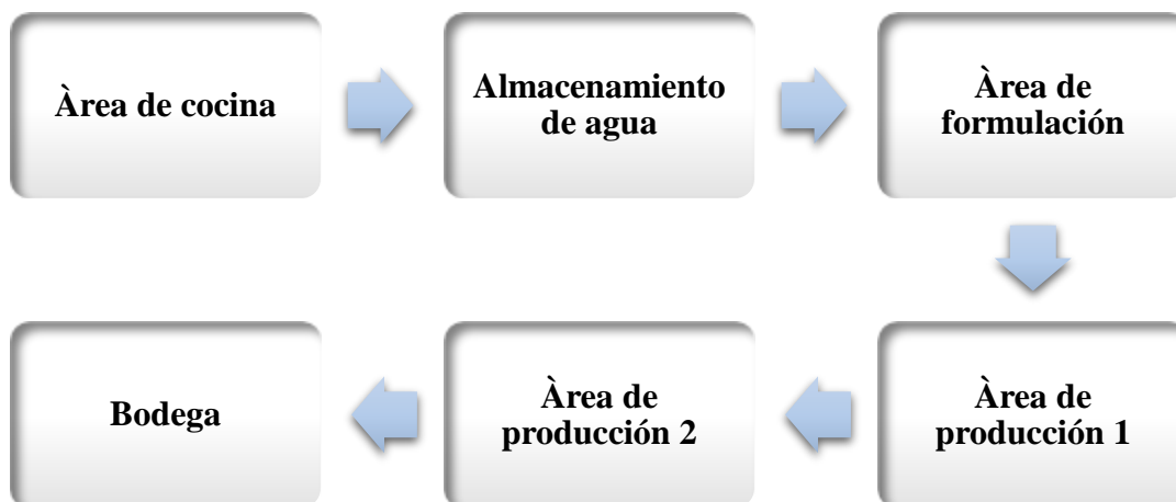
Diagrama de flujo de proceso

Área de lavado: en esta área se lavan los materiales utilizados durante el procesamiento que corresponde a un área abierta con piso de ladrillo y desagüe apropiado que no permite la contaminación del producto por estancamiento de aguas de lavado ni otros residuos presentes.