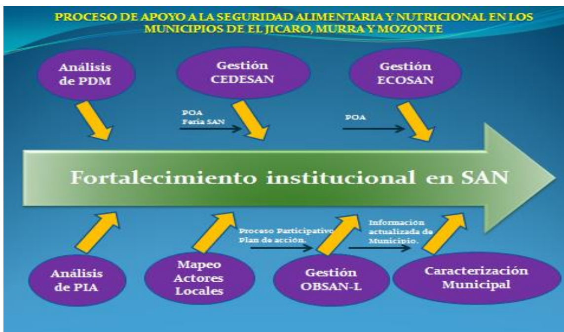
Figura 2. Proceso de apoyo a la SAN en los municipios de El Jícara, Murra y Mozonte.